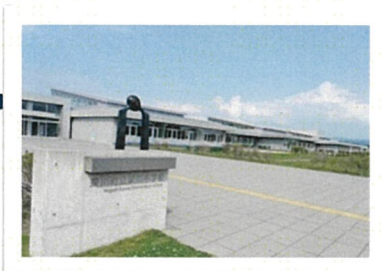
バレーボール会場