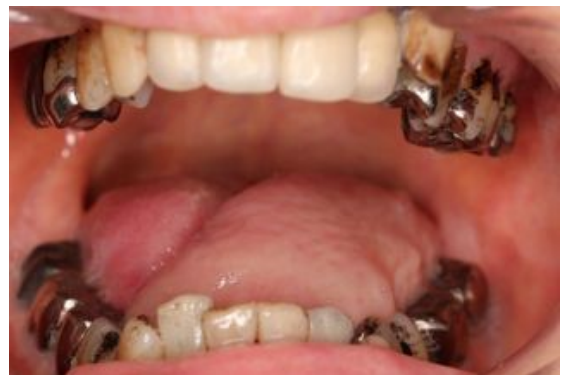
前腕皮弁で舌を再建