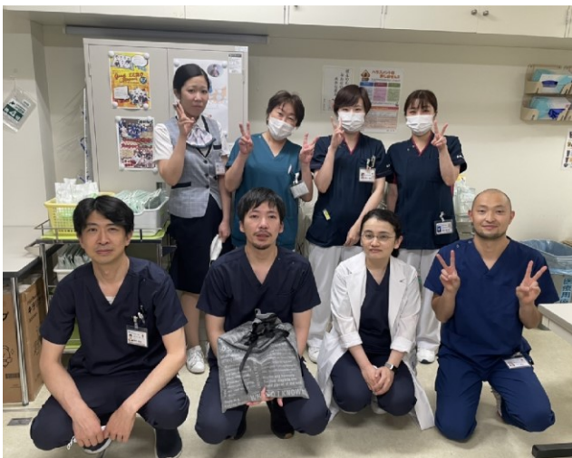
写真 口腔外科スタッフ

連携医療機関の皆様にはいつも大変お世話になっており、感謝しております。今後ともよろしくお願いたします。